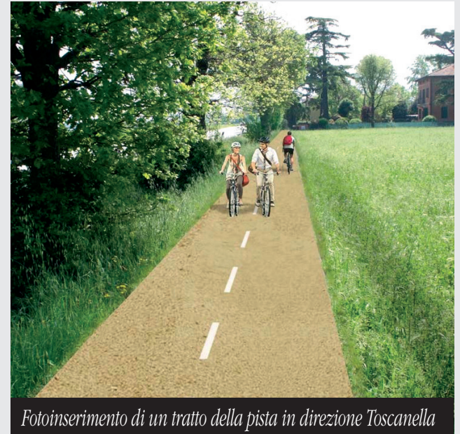
Fotoinserimento di un tratto della pista in direzione Toscanella