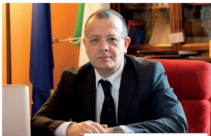
Il Sindaco Fausto Tinti

«L'ampliamento della Scuola Sassatelli è stato deciso in funzione della necessità di spazio per un numero crescente di alunni, ma avrà una duplice funzione – afferma il sindaco Fausto Tinti –. La nuova struttura sarà una mensa-auditorium polifunzionale, ben inserita nel contesto del parco. Una scuola aperta, luogo di incontro e di formazione a servizio della collettività. Questo progetto fa parte di un piano quinquennale di interventi relativi alle strutture scolastiche del territorio comunale. È un impegno economico forte, che deriva da una chiara volontà politica e amministrativa. Insieme alla realizzazione del polo scolastico di Osteria Grande e al trasferimento del-