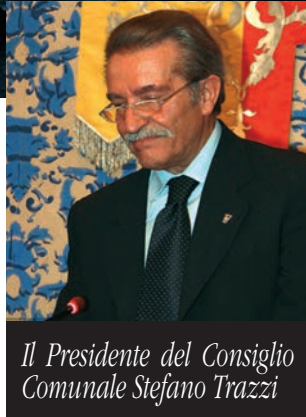
Il Presidente del Consiglio Comunale Stefano Trazzi

La particolare attenzione che l'Amministrazione dedica a questi temi si evidenzia anche nella partecipazione al progetto europeo Teeschools , che promuove lo sviluppo di sistemi innovativi per lo studio e l'ottimizzazione delle prestazioni energetiche degli edifici sco-