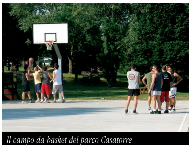
Il campo da basket del parco Casatorre