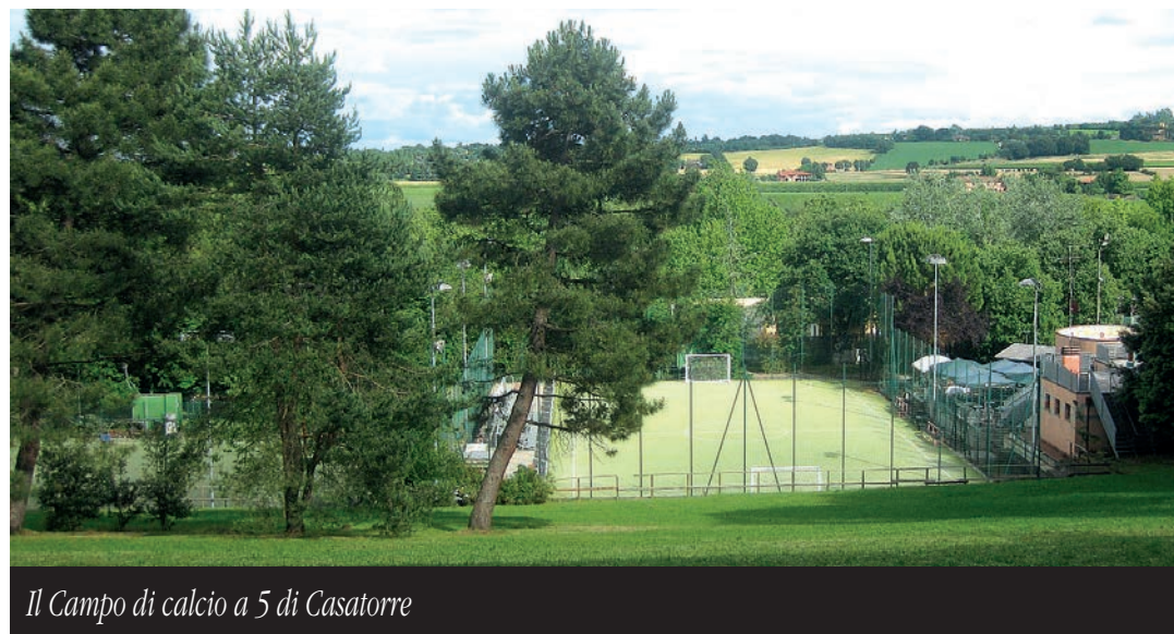
Il Campo di calcio a 5 di Casatorre