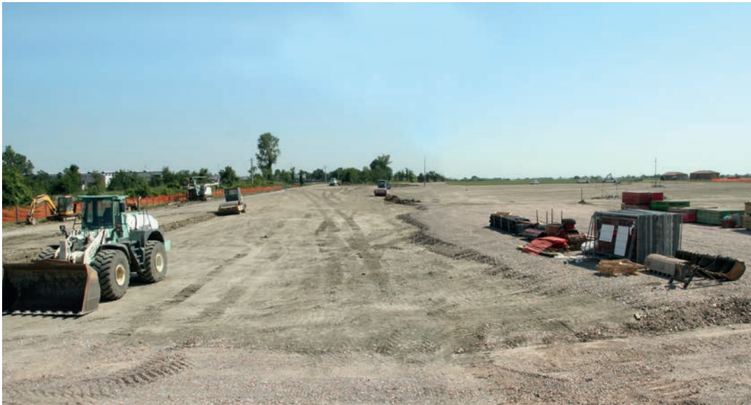
Il nuovo cantiere Decathlon

Con le due recenti convenzioni stipulate con le imprese FAP Investments e Bio-on, l'Amministrazione comunale guidata dal sindaco Fausto Tinti continua a raccogliere importanti frutti sul fronte dello sviluppo economico.